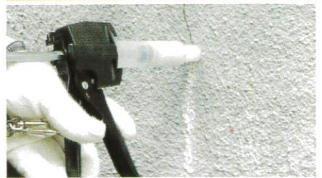
■ひび割れ注入作業(ハンドスモーター使用)