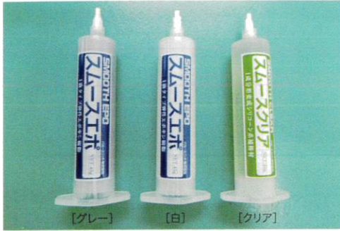
[グレー] [白] [クリア]