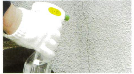
■ひび割れに対して高圧洗浄を行う内部洗浄