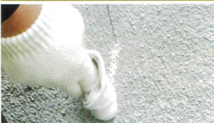
■注入充填後、ふきとり清掃仕上げ